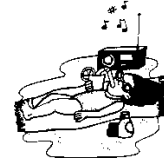
tomar el sol

Answer the questions using complete sentences.