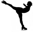
patinar en línea

Write the vocabulary word for each activity shown.